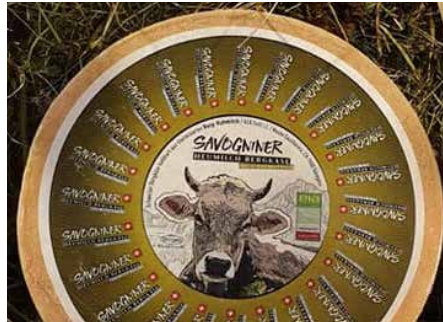
Savogniner Heumilch Bergkäse mit Parc Ela-Label

Sechs Bergbauern liefern ihre Milch an die «Nossa Caschareia». Hier wird die Milch zu feinen Produkten wie Yoghurt, Butter oder Käse verarbeitet. Dazu gehört auch der Savogniner Heumilch Bergkäse in drei Sorten und Mutschlis, die nun mit dem Parc Ela-Label ausgezeichnet worden sind. Der Käse wird vier bis sechs Monate bis zum gewünschten Reifegrad gepflegt.