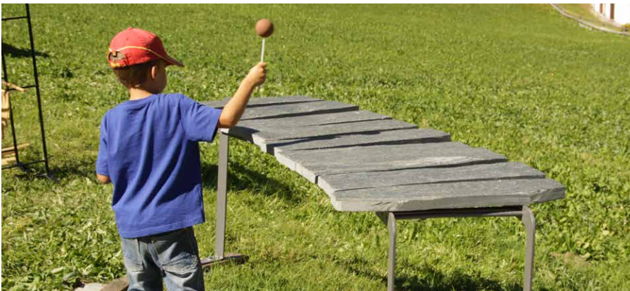
Klanggarten am Felsenfest - verschiedene Musikinstrumente zum Klingen bringen

Machen Sie am 13. Felsenfest Parc Ela in Bivio eine musikalische Zeitreise in die Steinzeit und entdecken Sie Kunst, Handwerk und Klänge aus Stein und Fels. Neu: Open-Air mit Live-Bands am Vortag.